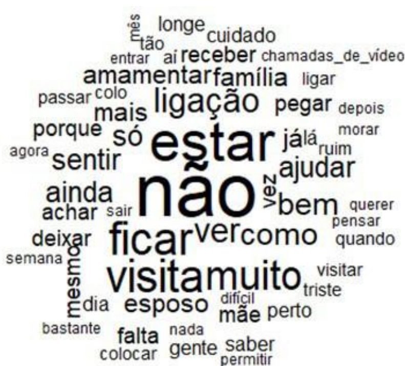
Figura 3 - Nuvem de palavras. Fortaleza, Ceará, Brasil, 2021