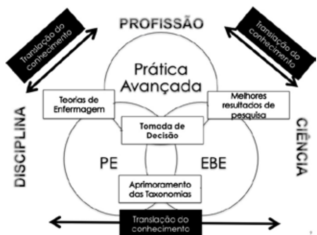
Figura 1. Práctica Avanzada en Enfermería y la traslación del conocimiento.

En este sentido, es posible vislumbrar la traslación del conocimiento, solución de problemas de salud, la resolución de gaps entre el panorama académico y la práctica profesional, en el proceso de evolución y consolidación de la enfermería.